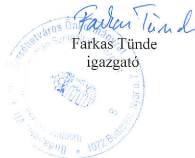
Farkas Tünde igazgató

Budapest, 20. 20 év..... 01 .....hó..... 23 nap